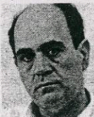
Του Χάρη Καμπουζίδη

Α νδρική ή γυναικεία τέχνη είναι η ζωγραφική; «Πανανθρώπινη» θ' απαんとύσε κανείς αυθόρμητα, όμως η αλήθεια είναι πιο περίπλοκη. Ως αρχέγονη δημιουργία, η τέχνη είναι σαφώς γυναικεία, αφού συνδέεται με την ίδια τη γέννηση και τις μαγικές τελετουργίες της. Ως κοινωνικό προϊόν είναι αποκλειστικά σχεδόν ανδρική, αφού οι επαγγελματίες «εικονοποιοί» ήταν πάντα άνδρες και στην υπηρεσία ιδεολογικών ανα-