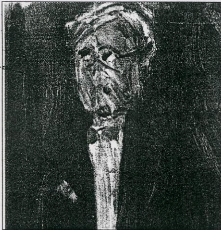
"Ανθρωπάκι" της Ιωάννας Ξανθοπούλου.