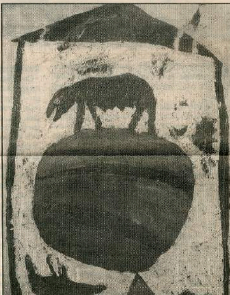
«Μνημείο για τους ακροβάτες» του Νίκου Μιχαλιτσιάνου

Το γχείρημα μου θυμίζει ένα τραγουδάκι του Λουκιανού από τα «Μικροαστικά» του Νεγρονόνη, σχετικά με τη γυμναστική. Εκεί δίνονται οδηγίες για ασκήσεις που πρέπει να κάνει κανείς, αρκεί να σηκωθεί πρώι. Καταλήγει ωστόσο ότι όσοι σηκώνονται πρώι δεν έχουν ανάγκη από γυμναστική.