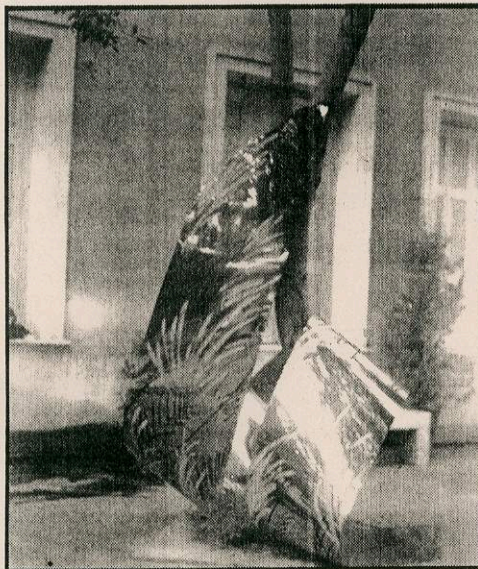
«Το προπατορικό αμάρτημα». Έργο της Μαρίας Στραπατσάκη, από την έκθεση της γκαλερί «Μέδουσα» στη Δημοτική Πινακοθήκη

λάβουμε πως ό,τι κι αν έγινε σ' αυτό τον τόπο στον τομέα των εικαστικών, από τους γκαλερίστες κατορθώθηκε, και όχι από το κράτος. Μήπως η προσπάθεια της γκαλερί «Μέδουσα» να δείξει την έκθεση και στο εξωτερικό, θα