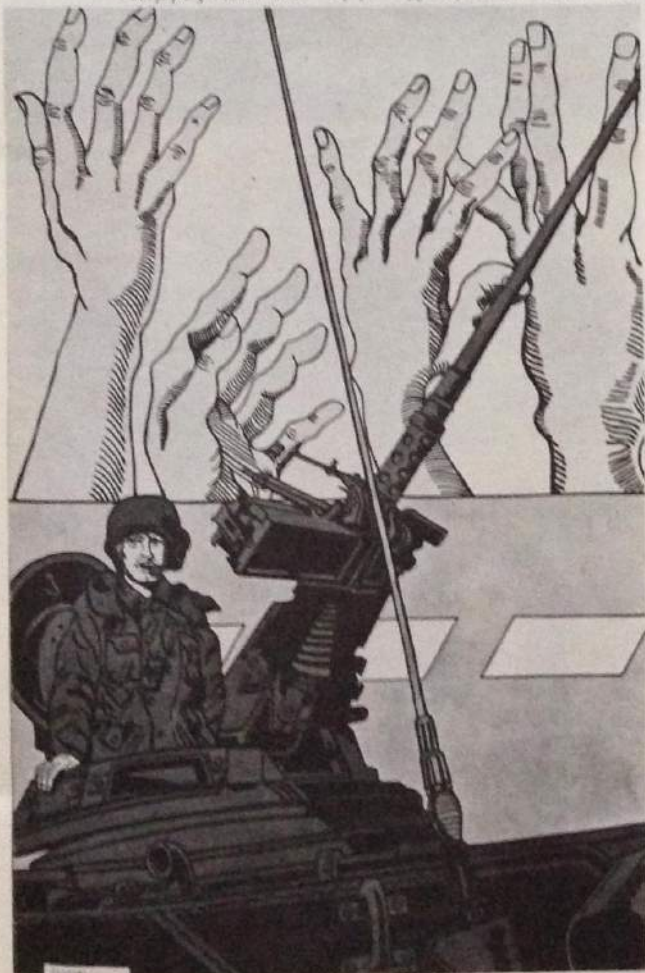
Γιόργος Ιωάννου: Έργο της περιόδου 1967-73.

τες και ελπίζουμε ότι θα επιτύχει πιο ώριμες αναζητήσεις στο μέλλον.